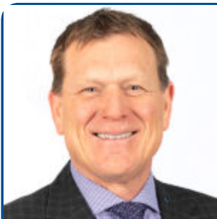
By Brian Van Doormaal

des animaux donne une meilleure indication des femelles qui sont plus susceptibles de posséder le génotype A2A2 ou de produire des filles qui pourraient le posséder.